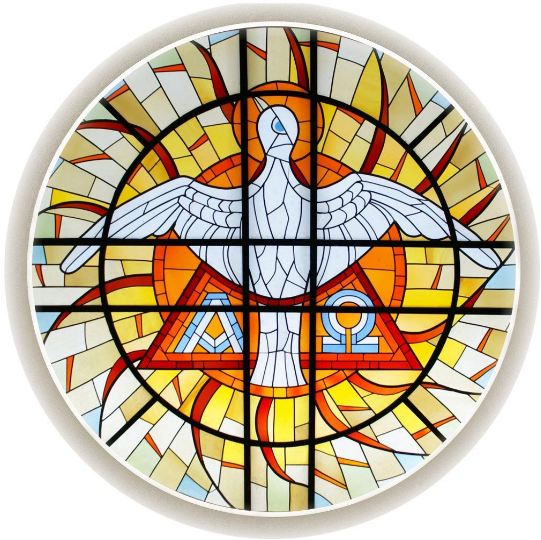
Bild: Foto: Martin Manigatterer / Kunst: Glaswerkstätten im Stift Schlierbach / Standort: Fatimakapelle Schardenberg / In: Pfarrbriefservice.de

Redaktionsschluss für das nächste Pfarrblatt: Do, 22.06.2023