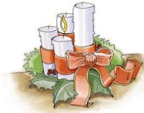
Bild: Christian Schmitt (Layout), factum.adp (Grafiken), crosswordlabs.com (Rätsel) In: Pfarrbriefservice.de